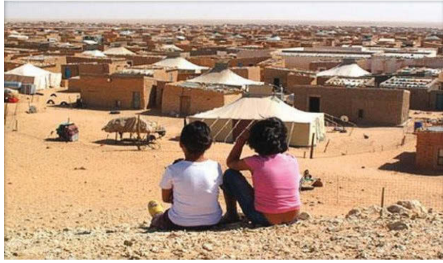
المحتلة من الصحراء الغربية"، كما اضاف وخدا بفسب وكالة الانباء الجزائرية، بينما وخدا فاطلاق النار المبرم في 1991.

وبحسب المنسق الصحراوي مع بعثة الأمم المتحدة إلى الصحراء الغربية محمد خداد، فإن البوليساريو "تأمل في أن تسمح الزيارة بتسريع الجهود المبذولة لصالح إنجاز عملية زوال الاستعمار عن الصحراء الغربية". واثناء محادثاتهم مع روس، سيطلب قادة البوليساريو "أن تضمن بعثة الأمم المتحدة السهر على حقوق الإنسان في الأراضي