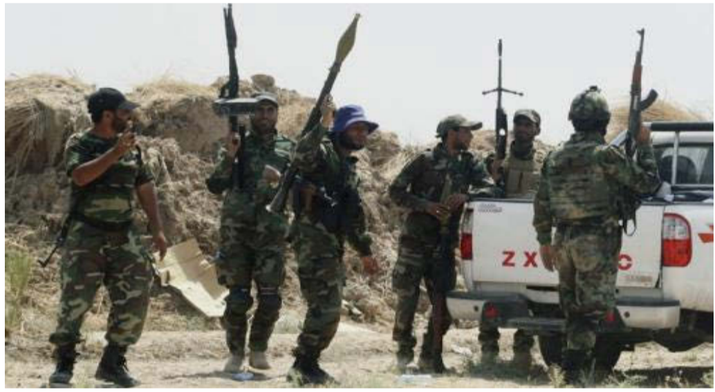
انطلقت عملية تحرير تكريت بسلسلة من الغارات الجوية نفذتها الطائرات الأميركية والعراقية بالتراشق مع قصف مدفعي عراقي لاهداف "داعش"